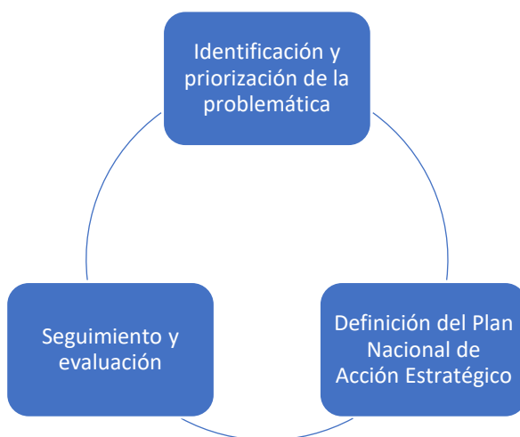
Ilustración 2: Metodología para definir el Plan Nacional de Acción Estratégico

El presente Plan Nacional de Acción Estratégico ALA/CFT/CFPADM 2022-2025 contempla tres (3) fases de: 1. Identificación y priorización de la problemática, 2. Definición Plan Nacional de Acción Estratégico, y 3. Seguimiento y evaluación. Estas fases se han definido siguiendo la metodología general del Estado Ecuatoriano para la elaboración, implementación y monitoreo de políticas públicas 1 .